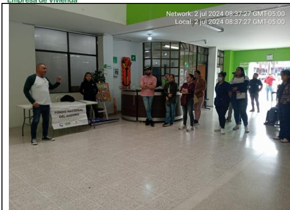
ASESORIA Y ORIENTACIÓN A PARTICIPANTES