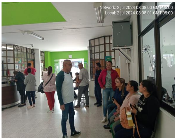
Parque Educativo desarrollo de la jornada de Bancarización y Asesoría