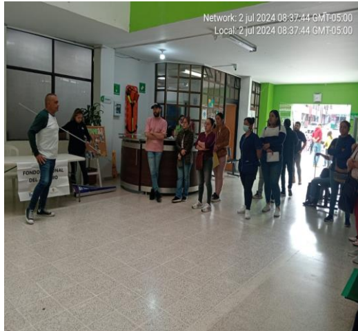
Apertura de la jornada y Posicionamiento marca VIVA