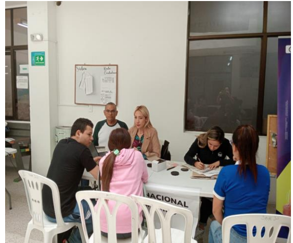
Atención e inscripción Fondo Nacional del Ahorro FNA