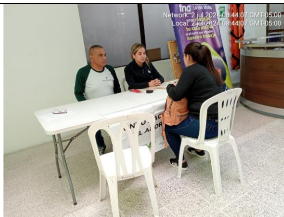
INSCRIPCIÓN AL FONDO NACIONAL DEL AHORRO